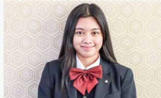
進路を決めた先輩たち

私が受験で大切だと思ったことは2つあります。1つ目は、志望校をできるだけ早く決めることです。そして合格に向けて勉強をし、いろいろなことに挑戦してほしいです。2つ目は、高め合える仲間を作ることです。少し諦めたいときがあっても、周りに頑張っている友達がいるので、私もあきらめずに頑張ろうと思えました。分からないことがあれば、友達や先生に頼って下さい。このおかげで私は志望校に合格することができました。最後まで諦めずに、本当に行きたい志望校に合格できるよう後悔のない努力をしてほしいです。